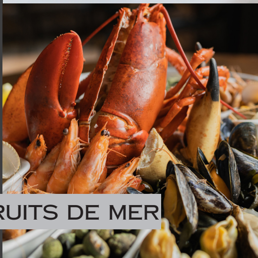
LES FRUITS DE MER